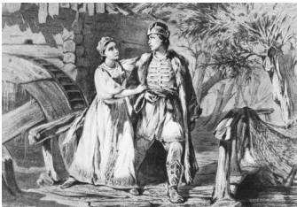
Русалка. Ілюстрація художника Трутовського К.

Как бросилась без памяти я в воду Отчаянной и презренной девчонкой И в глубине Днепра-реки очнулась Русалкою холодной и могучей, Прошло семь долгих лет – я каждый день О мщенье помышляю... И ныне, кажется, мой час настал.