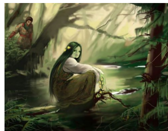
Русалка. Ілюстрація до поеми Пушкіна О.С.