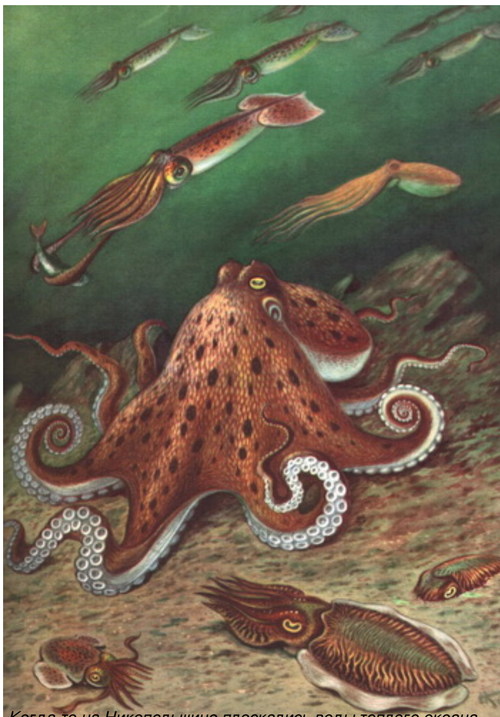
Когда-то на Никопольщине плескались воды теплого океана