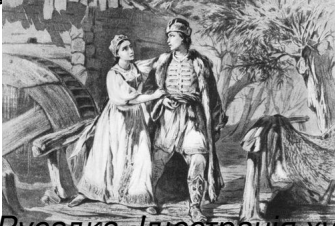
Русалка. Ілюстрація художника Трутовського К.

Дніпровська Русалка - опера в 1 акті на російській мові, написана в 1827 році українською оперною командою під керівництвом композитора О.С. Даргомижського.