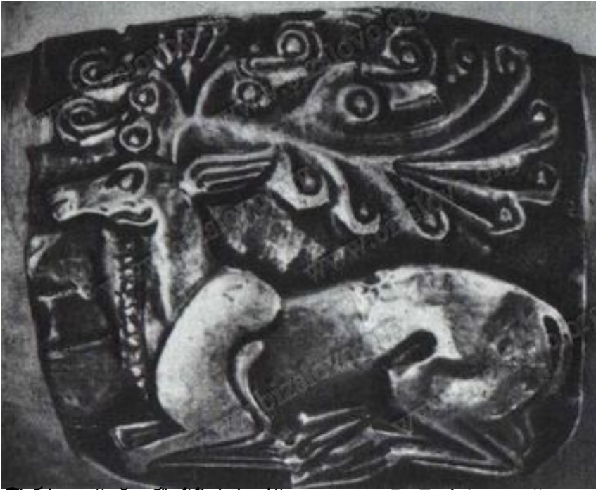
Металева пластина з рельєфним зображенням леопарда, що лежить на спині, оточеного квітами та іншими фігурами. Знайдено в селі Мозолів, 1906 р.