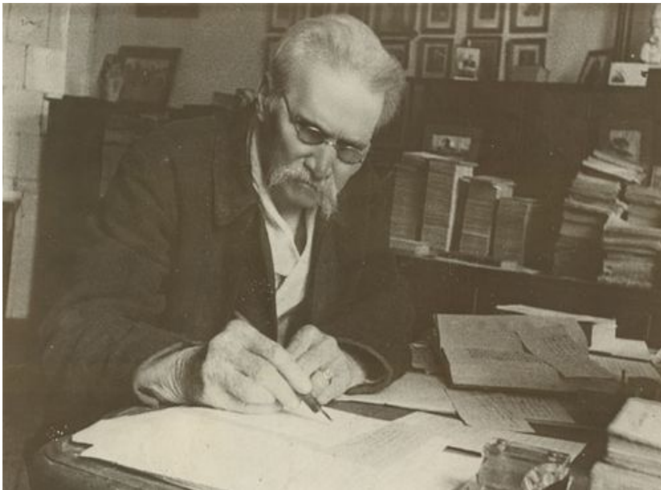
Яворницкий Д.И.

Д.И. было предложено возглавить экспедицию и описать пороги. На то время ему шел уже 74 год. Книга "Дн епровские пороги" вышла в 1928 году в Харькове ( фото порогов ).