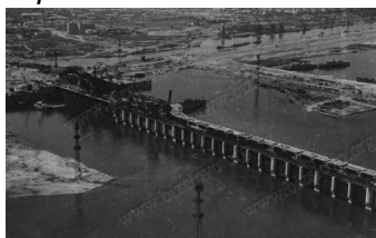
Каховская ГЭС. Водосливная плотина после затопления. 1955 г.

"Всю зиму поднимались воды Днепра, заливая плавни, озера. А весной, когда по всем притокам из верховьев тронулся лед, а за льдом богатейшее половодье, - весь Днепровский Низ от Запорожья к Каховке сразу стал неузнанным. Пошел под воду большой Запорожский Луг, утонули навеки старые кресты на дедовских кладбищах. Исчезли реки Подпольная, Скарбна... Родилось море, бескрайнее, с необъятным морским горизонтом. Геологическое чудо! ...на дне которого затонувшее навеки детство" (Довженко А.П. "Поэма о море").