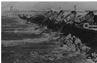
Строительство Каховской ГЭС. Перекрытие русла. Выход банкета с воды. 1955 г.

Дамба запущенной в ноябре 1955 года Каховской ГЭС задержала наводнение 1956 года и вырубленные и не полностью сожженные Конские и Базавлукские плавни стали дном рукотворного моря.